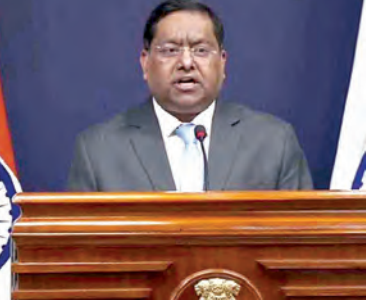
వెంటనే దేశం విడిచి వెళ్లాలని భారత్ సూచించింది. ఇరాన్ లోని తమ రాయబార కార్యాలయం అందించిన మారాలను ఉపయోగించి మరోవారి భారత్ తన పౌరులకు సలహా ఇచ్చింది. టెర్రోరిస్టులను భారత్ రాయబార కార్యాలయం బుడవారం ఒక నలహాలో పేర్కొంది, ఏప్రిల్ 7నాటి నలహాలో కొనసాగుతూ ఇటీవలి పరిణామాల దృష్ట్యా, ఇరాన్ లో ఉన్న భారత్ కు సలహాను సమీపించడానికి ప్రయత్నించవద్దని భారత్ రాయబార కార్యాలయం సూచించింది. రాయబార కార్యాలయంలో ముందస్తు సంప్రదింపులు, సమన్వయం లేకుండా ఏ అంతర్జాతీయ భూ సరిహద్దును సమీపించడానికి ప్రయత్నించవద్దని భారత్ రాయబార కార్యాలయం పేర్కొంది. ఈ నలహాలో, రాయబార కార్యాలయం తన పౌరుల కోసం అత్యవసర సంబంధన అందుబాటులో ఉంచింది.

న్యూఢిల్లీ, ఏప్రిల్ 8: అమెరికా-ఇరాన్ సంఘర్షణలో కాబుల విరమణ ప్రకటనపై భారత్ ప్రభుత్వం తోలిసారి స్పందించింది. బుడవారం విదేశాంగ మంత్రిత్వ శాఖ కాబుల విరమణను స్వాగతించి ఒక ప్రకటనను జారీ చేసింది. ఈ కాబుల విరమణ వశ్యమ అనియత శాశ్వత శాంతిని నెలకొల్పటానికి ఆసన్నున్నట్లు మంత్రిత్వ శాఖ పేర్కొంది. ఉద్రిక్తతలకు చర్చల ద్వారా పరిష్కారం లభించాలని భారత్ తరఫున మొదటి నుంచి వాదిస్తోంది. విదేశాంగ ప్రతినిధి రణదీప్ జైస్వాల్ వ్యాఖ్యానించారు. ప్రస్తుత సంఘర్షణకు త్వరితగతిన ముగింపు పలకడానికి ఉద్రిక్తతలను తగ్గించడం అత్యవసరమని, శాంతిని నెలకొల్పడానికి చర్చలు, దౌత్యం కీలకమని మేము నిరంతరం చెబుతున్నామని ఆ అయన అన్నారు. నెల రోజులకు పైగా కొనసాగుతున్న అమెరికా-ఇరాన్ల మధ్య సంఘర్షణ వల్ల జరిగిన నష్టంపై విదేశాంగ మంత్రిత్వ శాఖ తన ప్రకటనలో అందోళన వ్యక్తం చేసింది. ఈ ఘర్షణ ప్రపంచవ్యాప్తంగా అధిక సంఖ్యలో మరణాలకు దారితీసింది. ప్రపంచ వాణిజ్యం ఇకపై కొనసాగుతాయని ఆసన్నున్నట్లు పేర్కొంది.