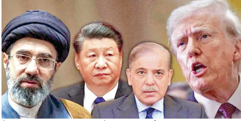
ప్రాంతభ్రమణి సమితి సందర్భంగా, చైనా శాంతిని ప్రోత్సహించడానికి, శత్రుత్వాలను నివారించడానికి చురుకుగా కృషి చేస్తోంది అన్నారు. కాబుల విరమణకు అంగీకరించడానికి ఇరాన్ కు చైనా

జెనెర్, ఏప్రిల్ 8: అమెరికా, ఇరాన్ల మధ్య 40వ రోజుకు చేరిన యుద్ధ కాల్పుల ఎత్తుకేలకు చర్చలయ్యాయి. ఇరాన్ పై జరిపే భారీ సైనిక దాడులనుంచి ట్రంప్ వెనక్కి తగ్గి, రెండు వారాల పరతులతో కూడిన కాబుల విరమణను ప్రకటించారు. ఈ నిర్ణయానికి, చోర్యుజ్ జలసంధిని తిరిగి తెరవడానికి మార్గం సుగమం అయ్యింది. ఈ ప్రకటన ప్రపంచవ్యాప్తంగా ఉత్సాహాన్ని కలిగించింది. ఈ కాబుల విరమణకు పాకిస్తాన్ ప్రధాని షాబాజ్ షరీఫ్, ఫిట్ మార్కెట్ అసెమ్ మునీర్ క్రెడిట్ తీసుకుంటున్నారు. కాబుల విరమణకు అంగీకరించే ఇరాన్ ను ఒప్పించడంలో చైనా కీలక పాత్ర పోషించింది. అమెరికా అధ్యక్షుడు డొనాల్డ్ ట్రంప్ నిన్ను దీనిని ప్రకటించారు. చైనా విదేశాంగ మంత్రిత్వ శాఖ ప్రతినిధి మాజీ సీనియర్ బుడవారం మీడియా సమావేశంలో మాట్లాడుతూ, ఇరాన్ వివాదం