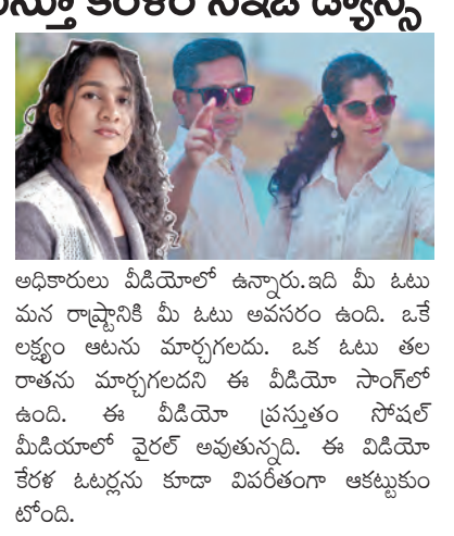
అధికారులు వీడియోలో ఉన్నారు. ఇది మీ ఓటుమన రాష్ట్రానికి మీ ఓటు అవసరం ఉంది. ఒకే లక్ష్యం అటను మార్చగలము. ఒక ఓటు తలరాతను మార్చగలము ఈ వీడియో సాంగ్ లో ఉంది. ఈ వీడియో ప్రస్తుతం సోషల్ మీడియాలో వైరల్ అవుతున్నది. ఈ వీడియో కేరళ ఓటర్లను కూడా విపరీతంగా ఆకట్టుకుంటోంది.