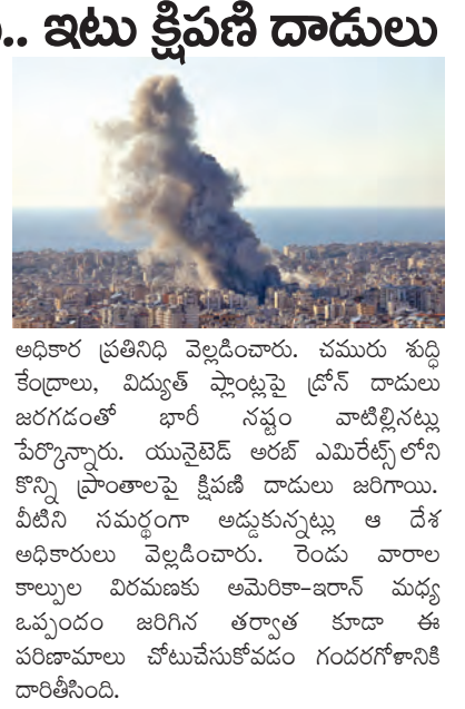
అధికార ప్రతినిధి వెల్లడించారు. చమురు శుద్ధి కేంద్రాలు, మిద్యుత్ ఫ్యాబ్రికేషన్ లోని దాడులు జరిగడంతో భారీ నష్టం వాటిల్లినట్లు పేర్కొన్నారు. యునైటెడ్ అరబ్ ఎమిరేట్స్ లోని కొన్ని ప్రాంతాలపై ఖబీషి దాడులు జరిగాయి. వీటిని సమర్థించి అడుక్కున్నట్లు ఆ దేశ అధికారులు వెల్లడించారు. రెండు వారాల కాల్పుల విరమణకు అమెరికా-ఇరాన్ మధ్య ఒప్పందం జరిగిన తర్వాత కూడా ఈ పరిణామాలను బోటుచేసుకోవడం గందరగోళానికి అడుక్కుందని కువైట్ రక్షణ మంత్రిత్వ శాఖ

టెల్ అవివ్, ఏప్రిల్ 8: అమెరికా-ఇరాన్ మధ్య కాల్పుల విరమణ ఒప్పందం కుదిరినప్పటికీ.. పశ్చిమాసియాలోని పలు ప్రాంతాల్లో దాడులు కొనసాగడం అందోళన రేకెత్తిస్తోంది. తమ దేశానికి చెందిన లావీన్ ద్వీపంపై బుడవారం దాడులు జరిగినట్లు ఇరాన్ వెల్లడించింది. ఈ దీవిలోని చమురు శుద్ధి కేంద్రాన్ని శత్రువులు లక్ష్యంగా చేసుకున్నట్లు పేర్కొంది. ఈ దాడి కారణంగా అయిల్ రిఫైన్ నరీత్ మంటలు చెలరేగాయని, ఆక్కడ సహాయక బలగా కొనసాగుతున్నారని ఇరాన్ మీడియా కథనాలు వెల్లడించాయి. అయితే, ఈ సమాచారం నెలకొనలేదు, అక్కడ సహాయక బలగా కొనసాగుతున్నారని ఇరాన్ మీడియా కథనాలు వెల్లడించాయి. దానిపై 28 ఇరాన్ దౌత్యం తమ గగనతల రక్షణ వ్యవస్థ అడుక్కుందని కువైట్ రక్షణ మంత్రిత్వ శాఖ